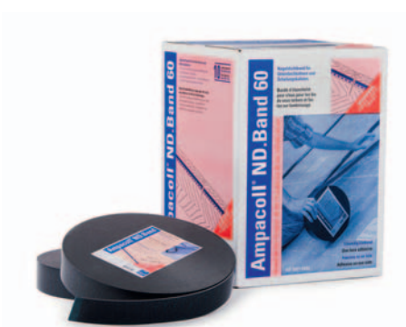
Ampacoll® ND.Band 60: Nageldichtband, 60 mm breit