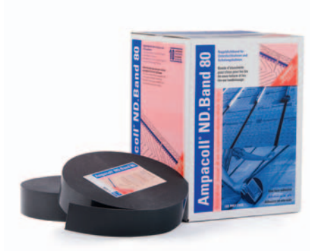
Ampacoll® ND.Band 80: Nageldichtband, 80 mm breit