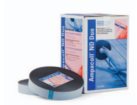
Ampacoll® ND Duo: Beidseitig klebendes Nageldichtband