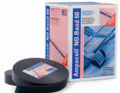
Ampacoll® ND.Band 60/80: Einseitig klebendes Nageldichtband, 60/80 mm breit