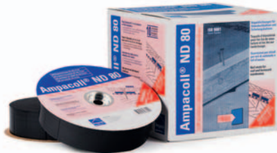
Ampacoll® ND 80: Nageldichtungen, 80 mm breit