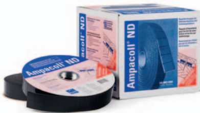
Ampacoll® ND 60: Nageldichtungen, 60 mm breit